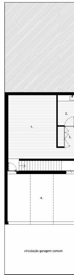
PISO -1 Basement