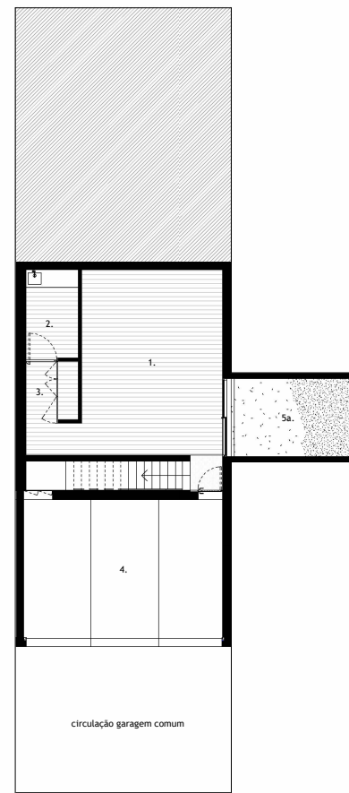
PISO -1 Basement