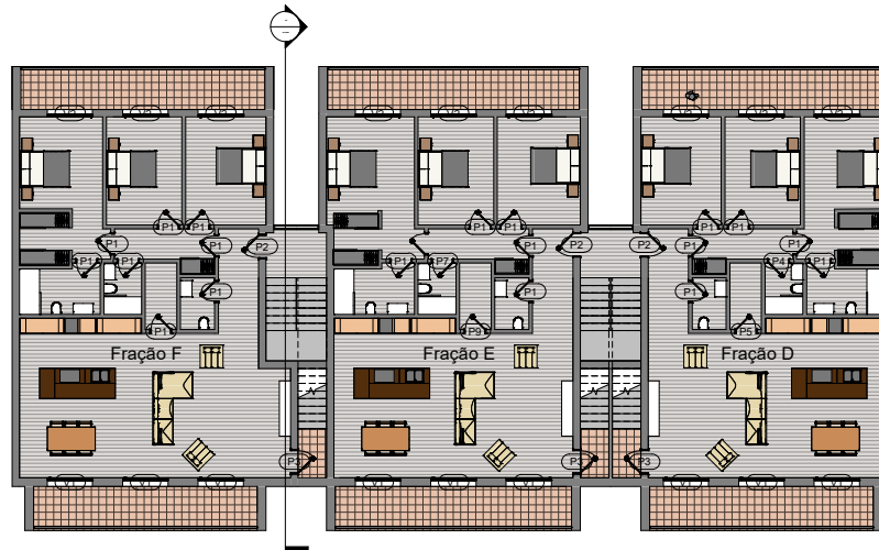
① Piso2 1 : 100