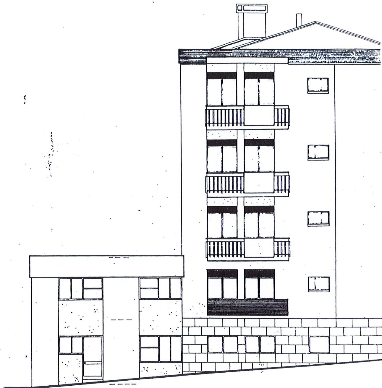
A. LAT. ESQUERDO