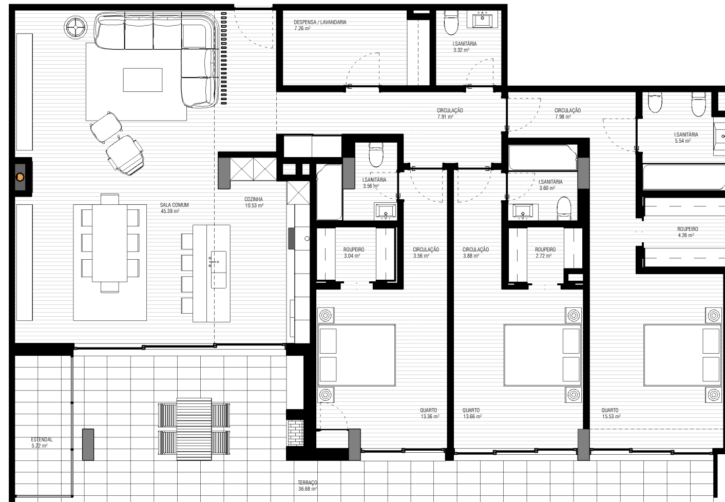
0 - FRACÇÃO 1 : 100