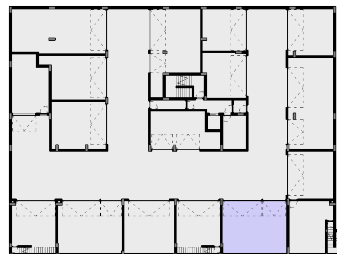
0 - BOX / ESTACIONAMENTO 1 : 500

INTERIOR / HABITAÇÃO 186,50 M 2 EXTERIOR 43,30 M 2