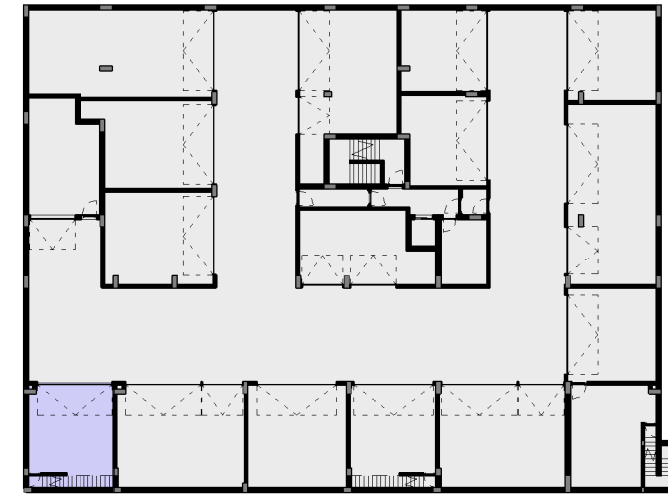
D - BOX / ESTACIONAMENTO 1:500

INTERIOR / HABITAÇÃO 175,80 M 2 EXTERIOR 122,10 M 2