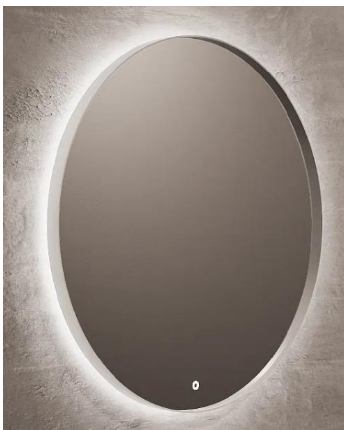
Imagem 23 – Espelho da BanhoAzis modelo “ITEK”