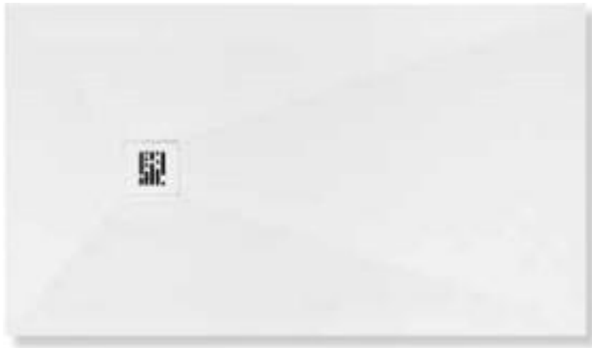
Imagem 20 – Base de duche em pedra