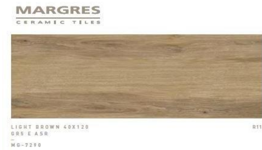
Imagem 1 - Cerâmica da Margres refª 412GR5.Light Brown R11