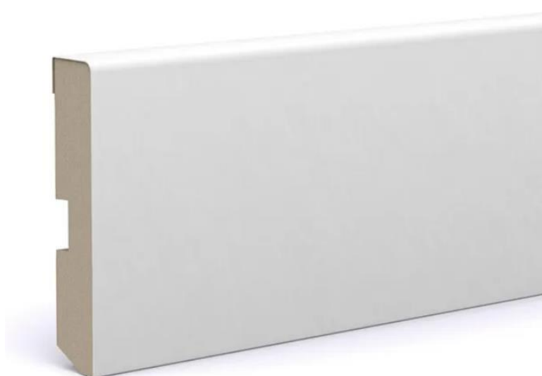
Imagem 7 – Rodapé em MDF lacado a branco