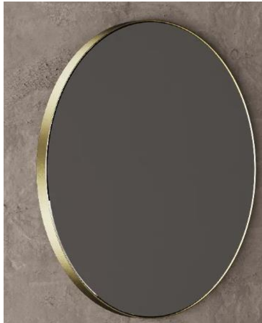
Imagem 22 – Espelho da BanhoAzis modelo “Rondo” dourado