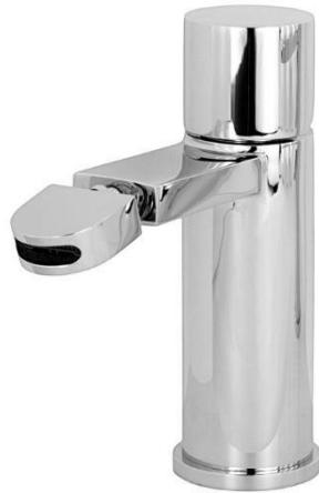
Imagem 19 – Misturadora de bidé na cor dourado