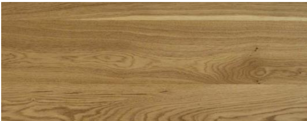
Imagem 6 – Soalho do tipo “Trevo Floors” na cor Carvalho Prime 155 Escovado