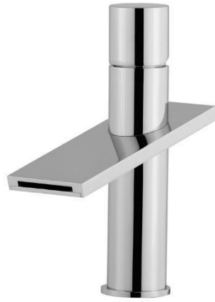
Imagem 16 – Misturadora na cor dourado