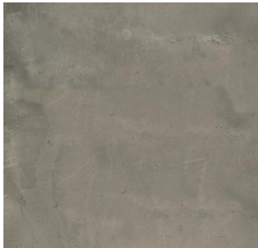
Imagem 11 – Cerâmica da Margres Linea Tool Grey refª TL4 NR