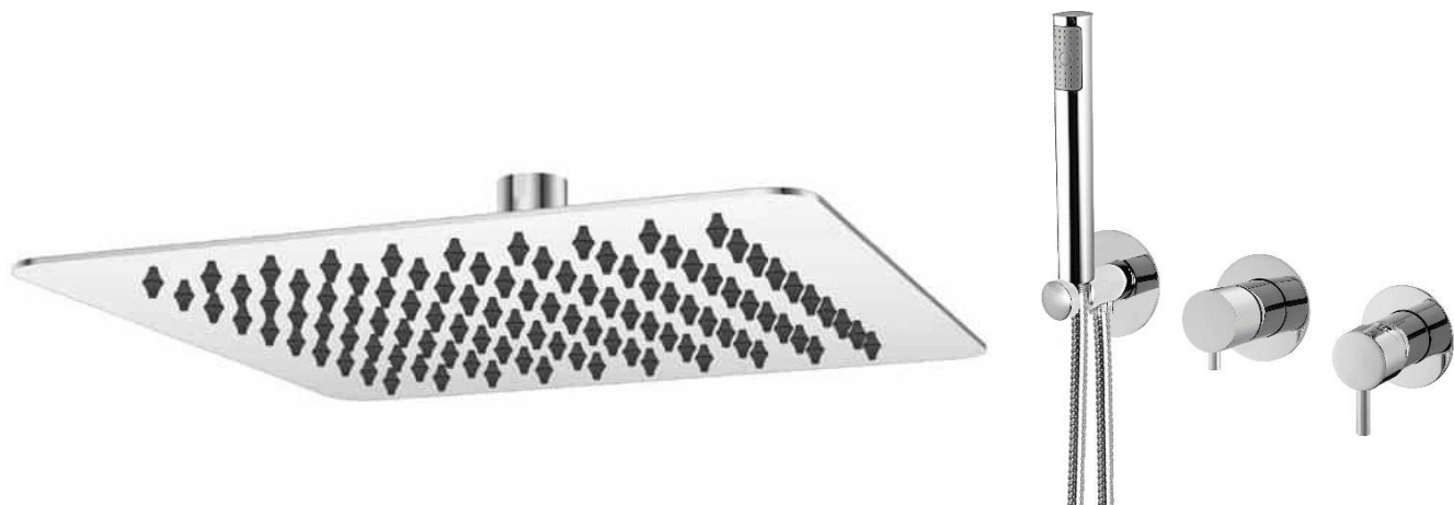
Imagem 21A – Chuveiro/misturadora da base de na cor inox