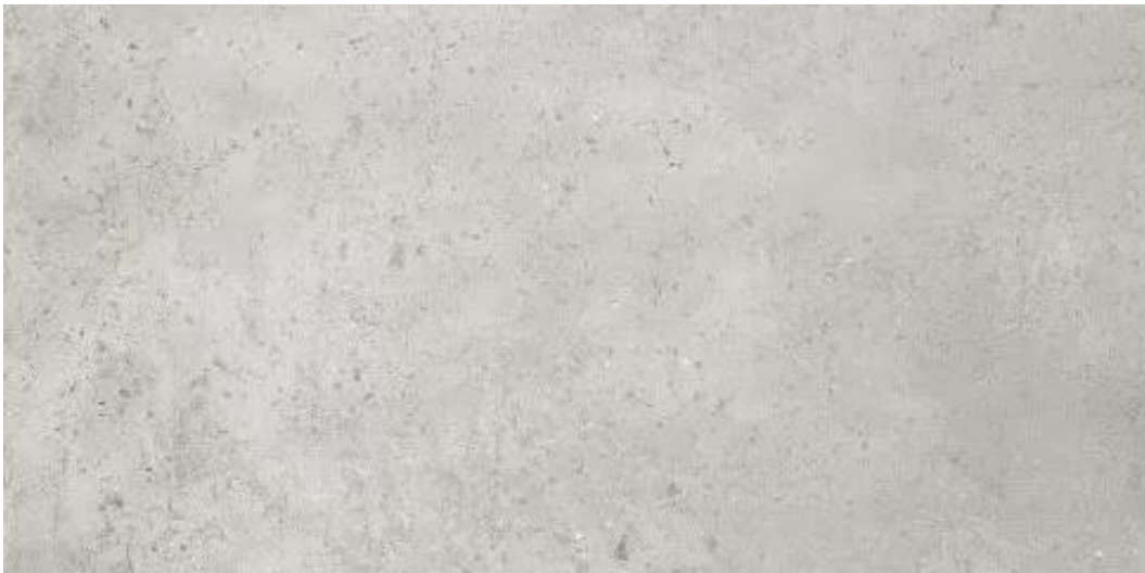
Imagem 5 – Pannel da cerâmica da Exagres refª “Litos Siberia C3 R”