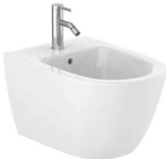
Imagem 18 – Bidé suspenso da Roca