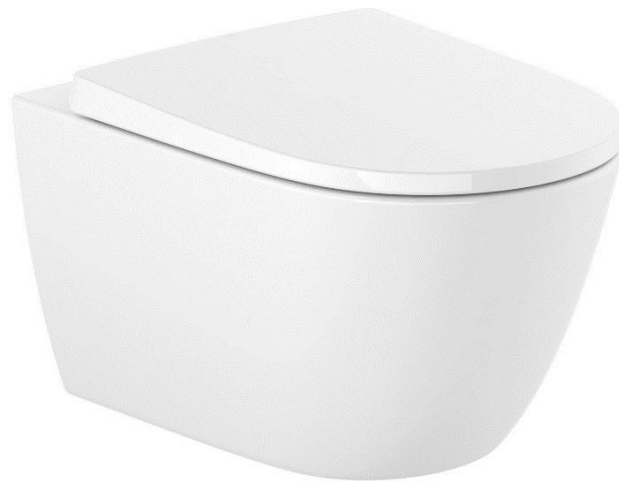
Imagem 17 – Sanita suspensa da Roca