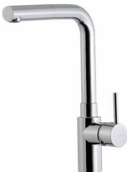
Imagem 13 – Misturadora da banca