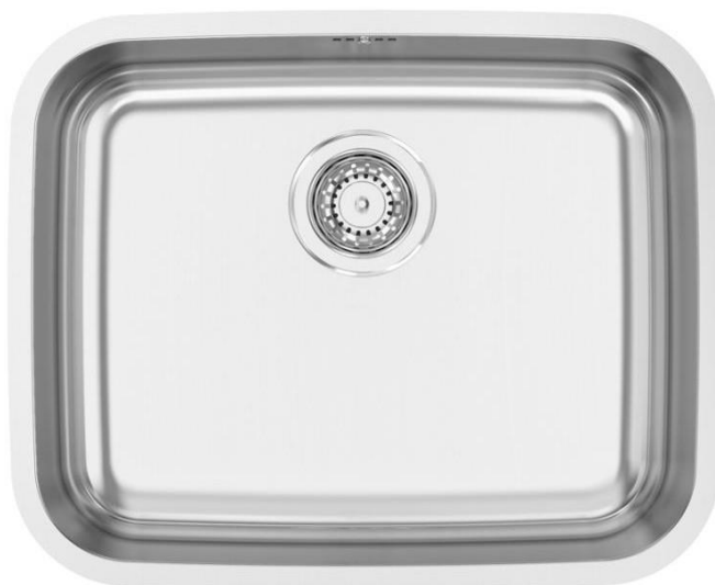
Imagem 14 – Banca da Rodi modelo “Belém”