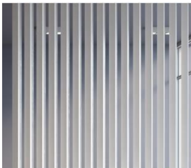
Imagem 9 – Ripado em madeira lacado a branco