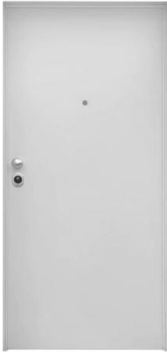
Imagem 10 – Porta de Entrada dos Apartamentos do tipo “Start Euro II”