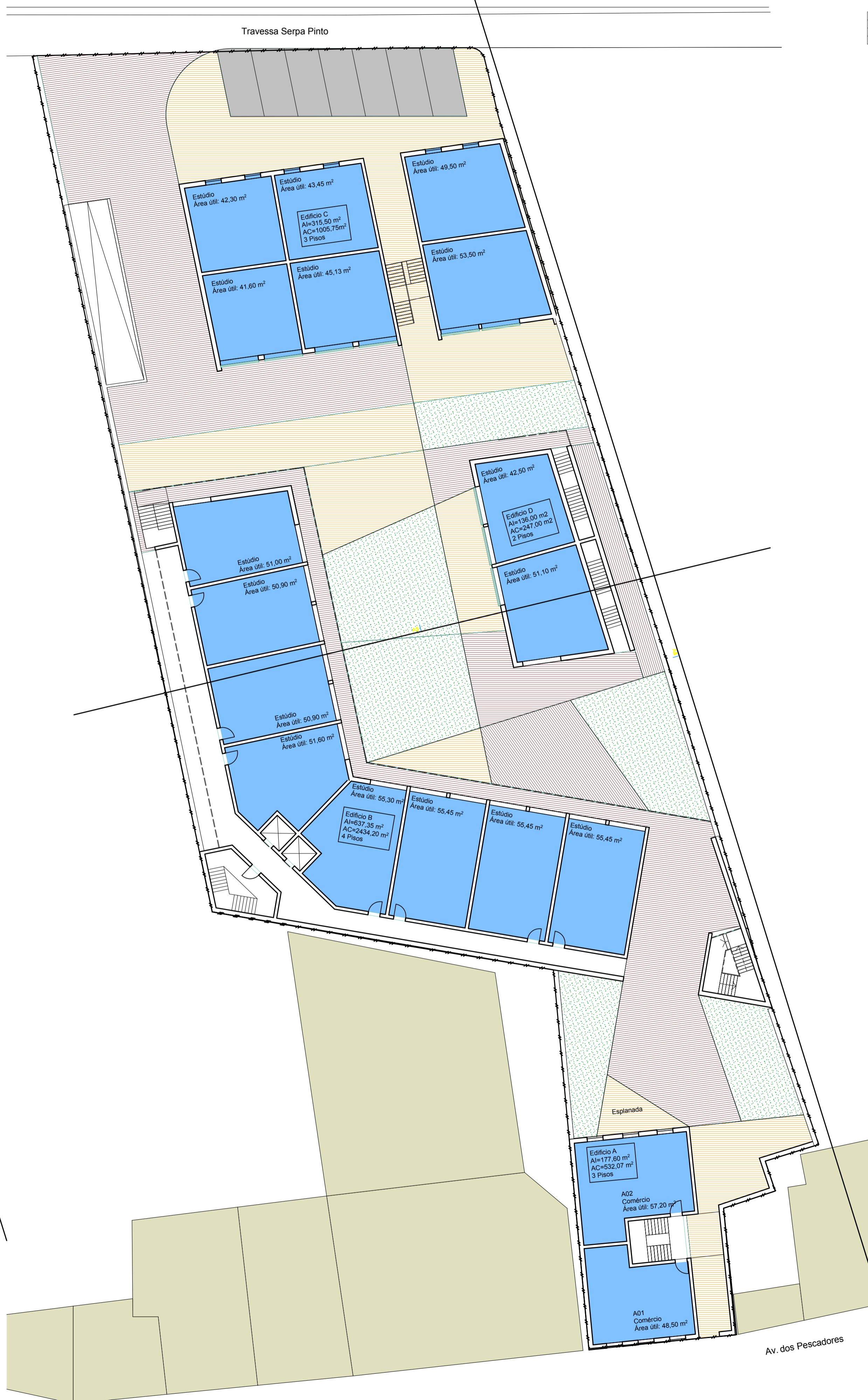
Planta de Implantação