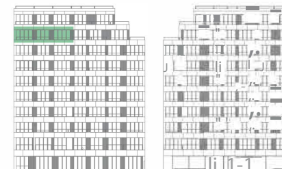
ALÇADO TARDOZ ALÇADO PRINCIPAL