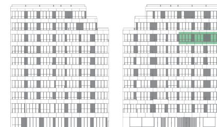
ALÇADO TARDOZ | ALÇADO PRINCIPAL