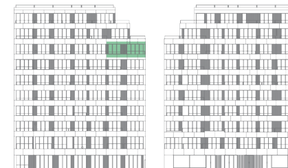
ALÇADO TARDOZ ALÇADO PRINCIPAL