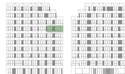
ALÇADO TARDOZ | ALÇADO PRINCIPAL