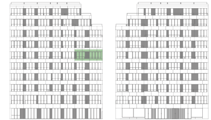
ALÇADO TARDOZ ALÇADO PRINCIPAL