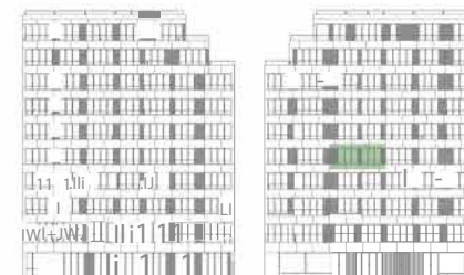
ALÇADO TARDOZ ALÇADO PRINCIPAL