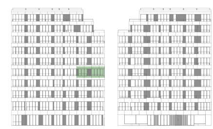
ALÇADO TARDOZ ALÇADO PRINCIPAL